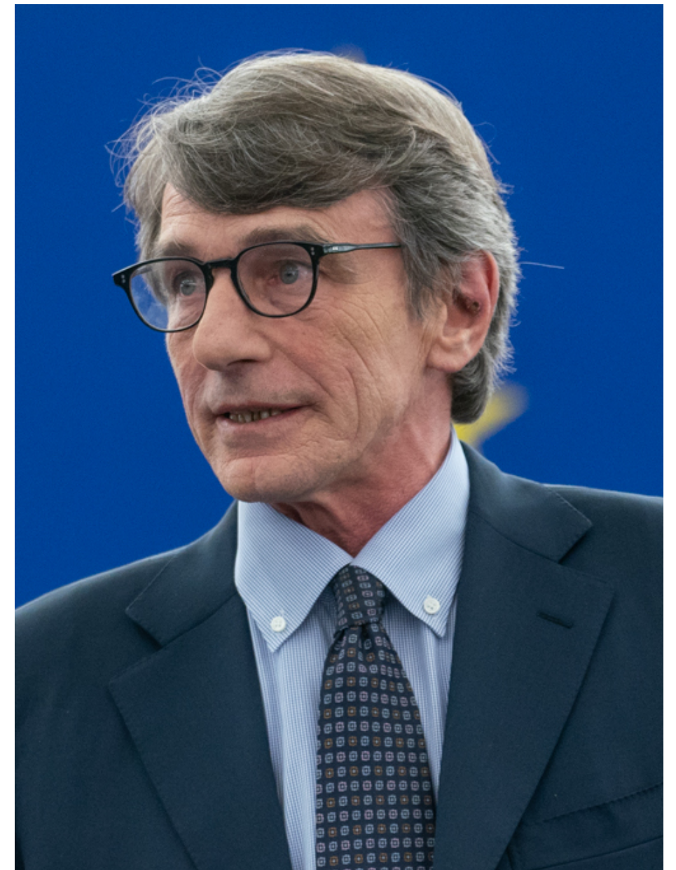
obecny przewodniczący parlamentu